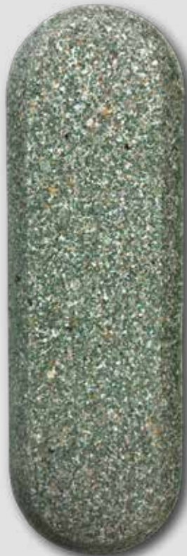
BOLUS DE 130 G