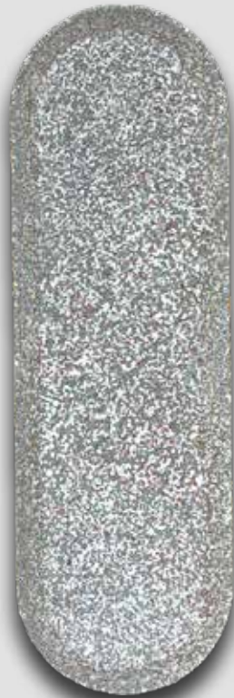
BOLUS DE 125G