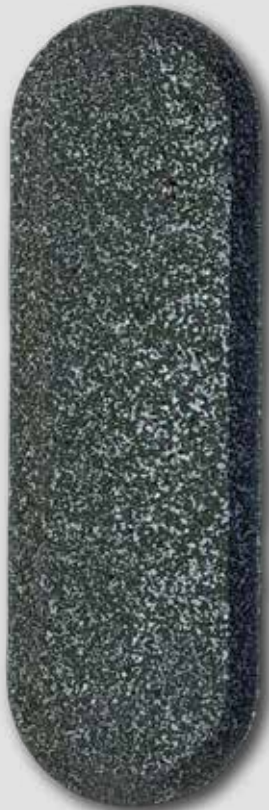
BOLUS DE 125G